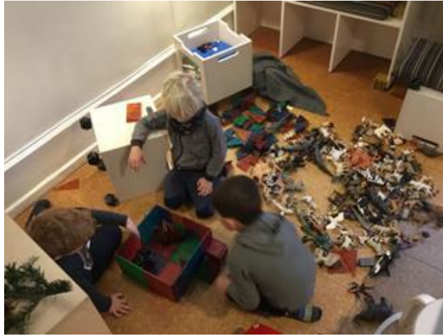
Fantasiaen får frit løb i leg med vennerne