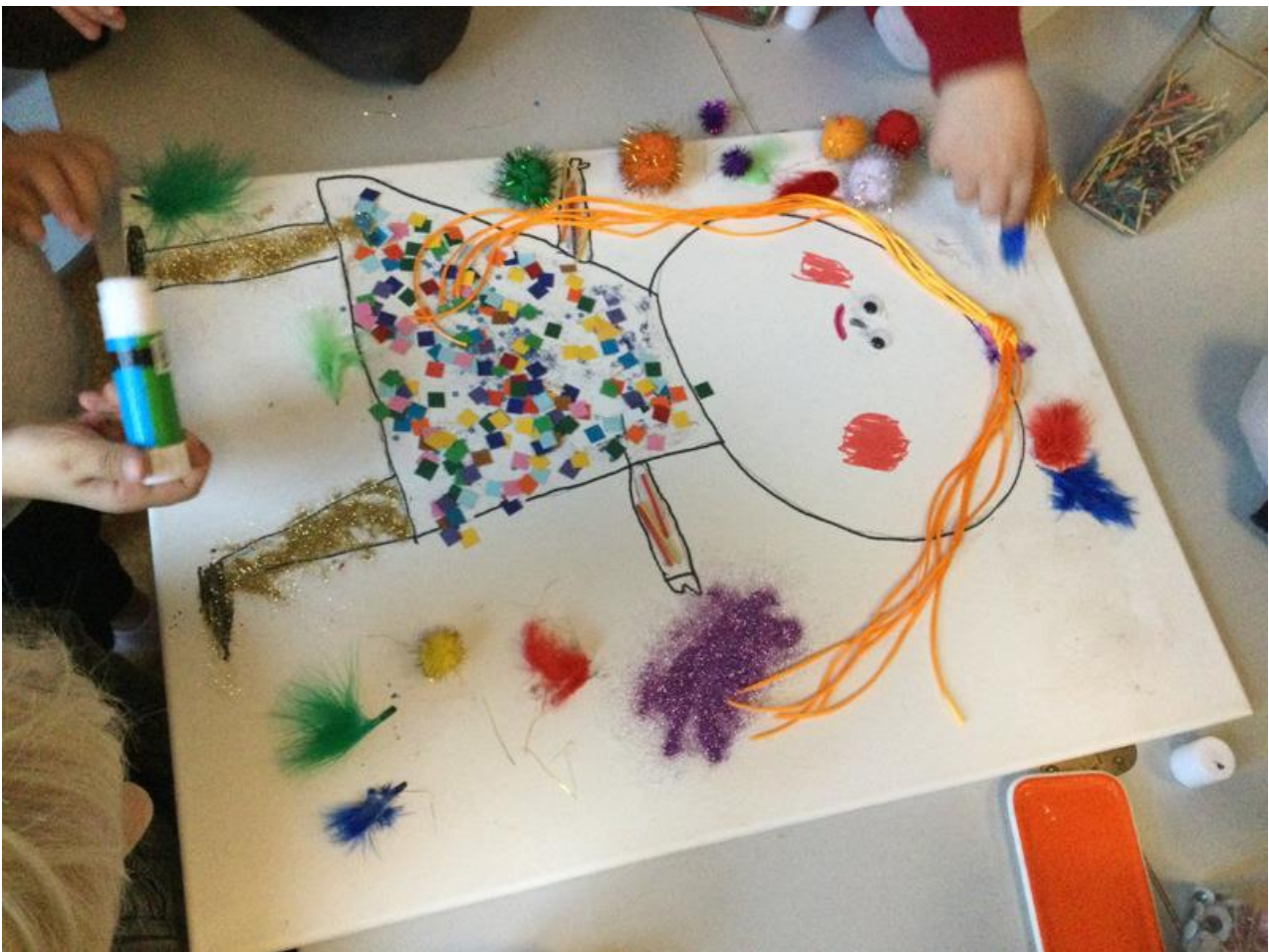
En af aktiviteterne fra temaet eventyr. Børnene skaber i fællesskab Guldlok.